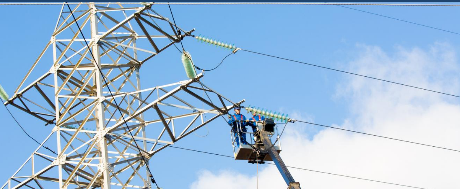
Rețea de distribuție energie electrică a Premier Energy, Republica Moldova