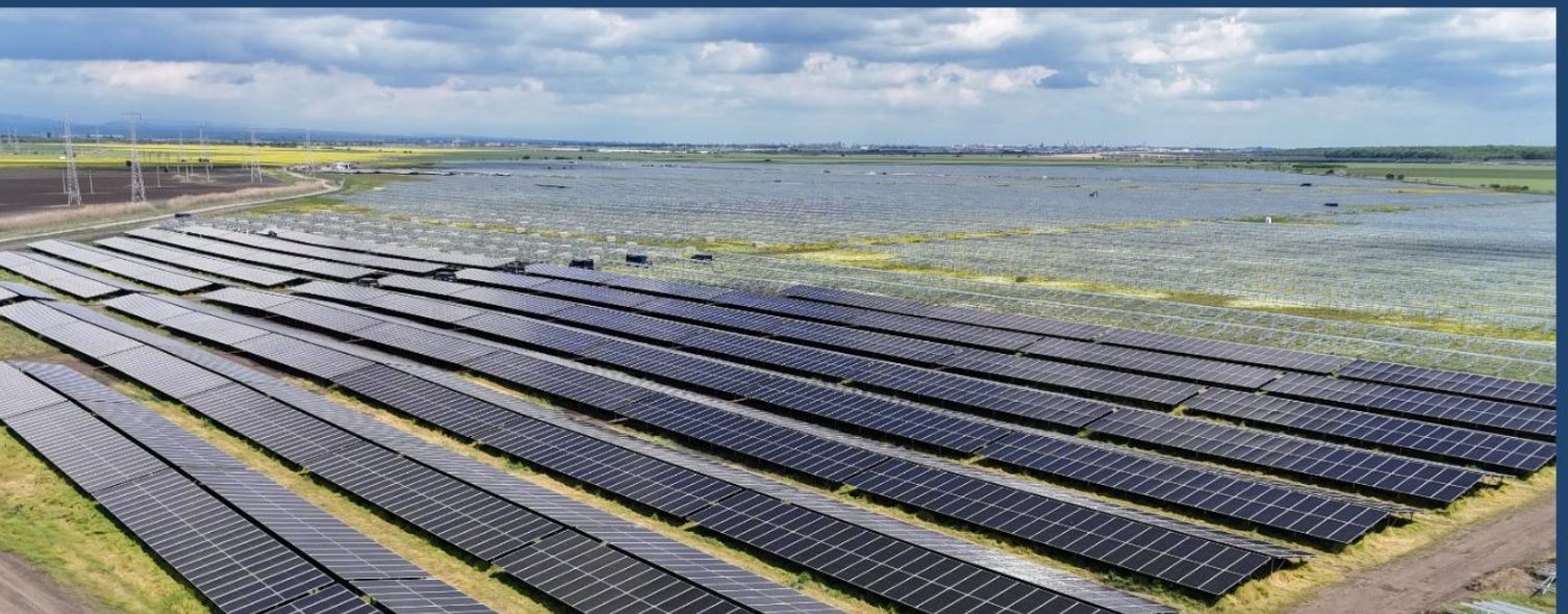
Parcul solar al Premier Energy cu o capacitate de 48 MW și un sistem de stocare a energiei în baterii de 16 MWh, în construcție, Buzău, România