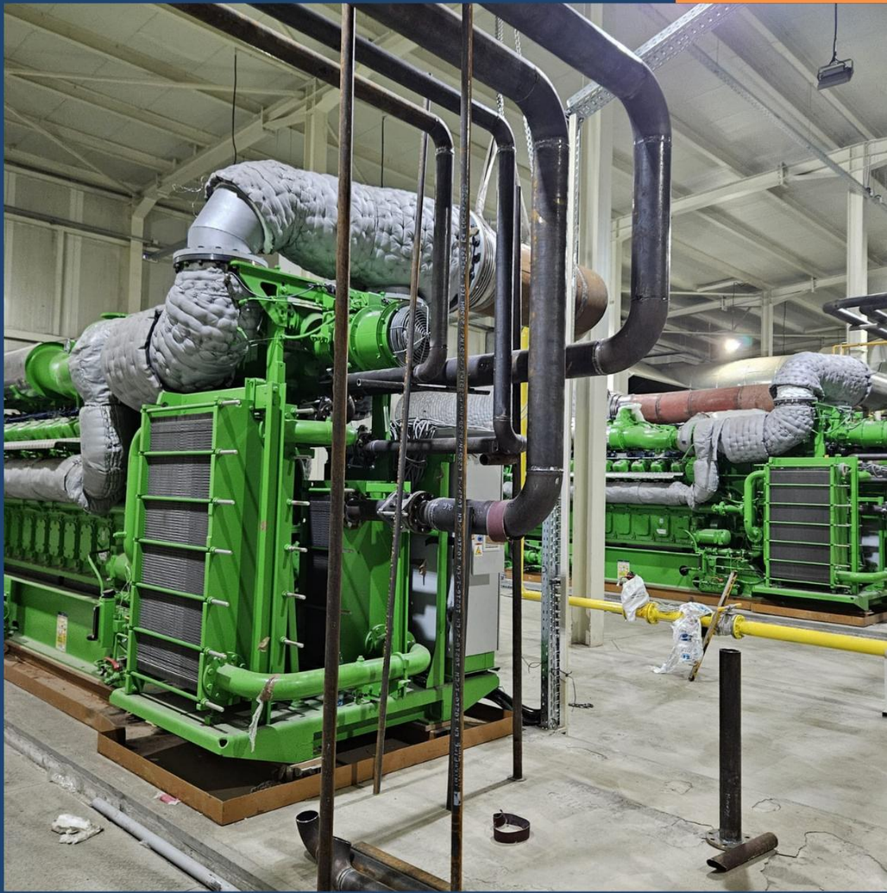
Noua turbină din centrala pe gaz a Premier Energy din Făgăraș, România, care ar trebui să devină operațională în iunie 2025.