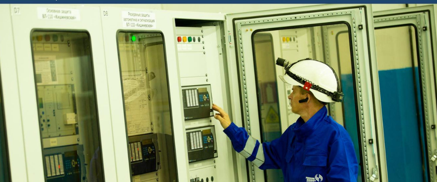
Panou rețea de distribuție energie electrică al Premier Energy, Republica Moldova