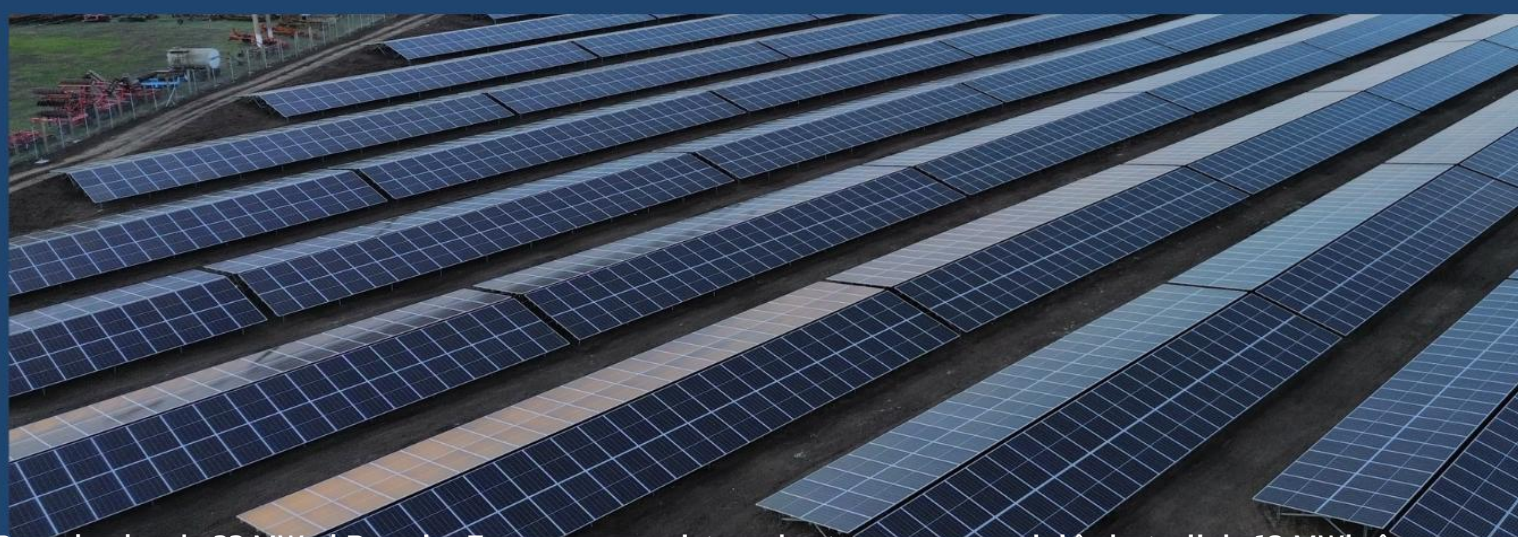
Parcul solar de 23 MW al Premier Energy, cu un sistem de stocare a energiei în baterii de 10 MWh, în construcție, Nanov, Teleorman, România